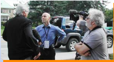
Montebello, août 2007