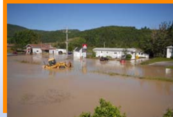
Rivière-au-Renard, inondations août 2007