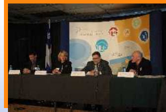
Mauricie, printemps 2007