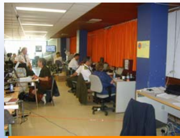
Montebello, août 2007