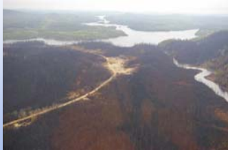
Senneterre, incendies de forêt, mai 2007