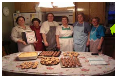
Groupe de cuisine communautaire de Kegaska