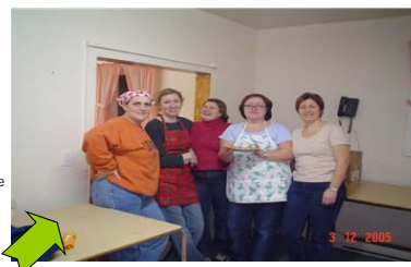
Groupe de cuisine communautaire de Blanc-Sablon