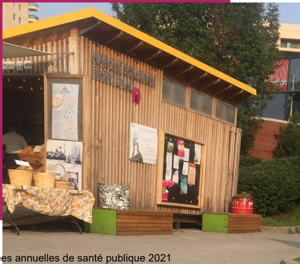
Journées annuelles de santé publique 2021

Construction de la serre Émily-de-Witt Stratégie alimentaire de Ville-Marie