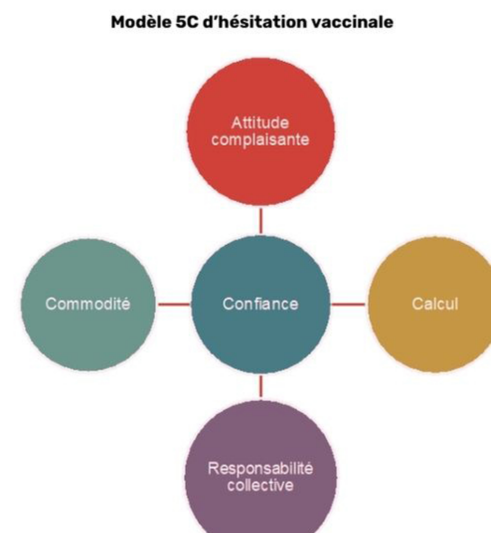
Figure 2: Adapté de Betsch et al., (2018)

Nous avons effectué un examen de la portée rapide sur les stratégies et les initiatives qui ont vu le jour en Amérique du Nord au cours de la pandémie de COVID-19.